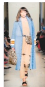
IN PASSERELLA Una sfilata di Ferragamo